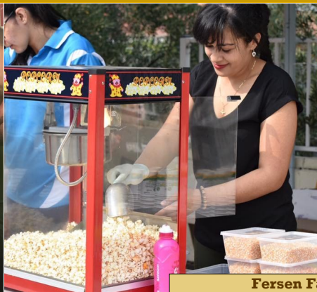
Fersen Family Fete