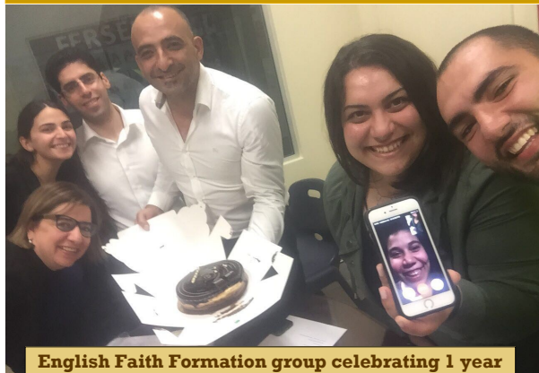
English Faith Formation group celebrating 1 year