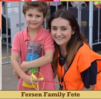
Fersen Family Fete