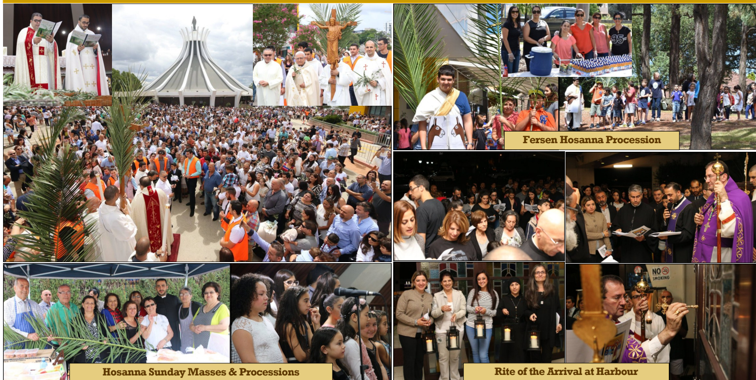
Fersen Hosanna Procession