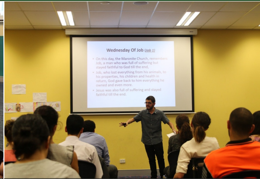
EFF 'Understanding Passion week in the Maronite church'