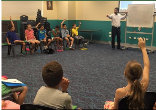
Fersen year 5 discussion on Sacrament of Baptism