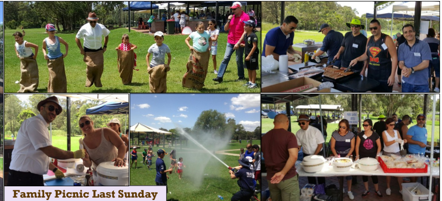
Family Picnic Last Sunday