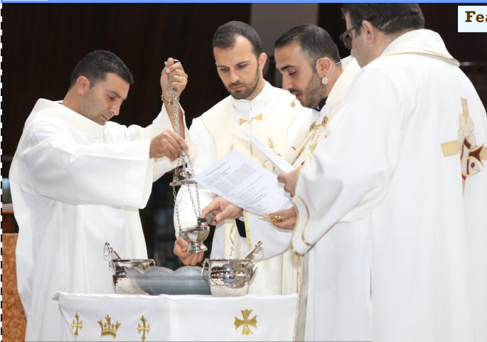
9.30 am Family Mass Altar Servers