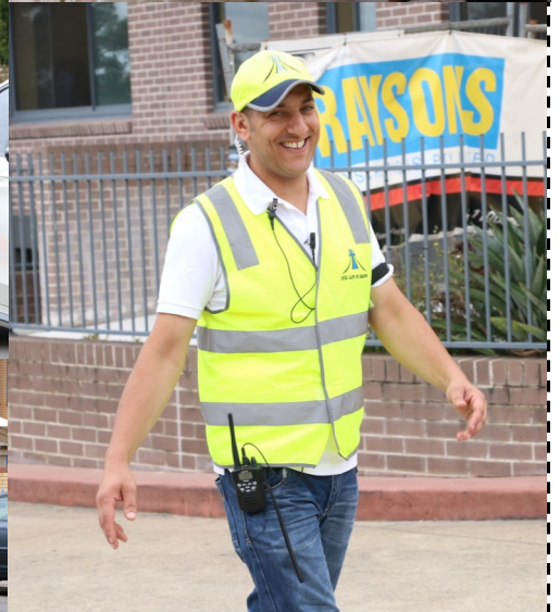
Thank you to our traffic controllers who always look after our safety