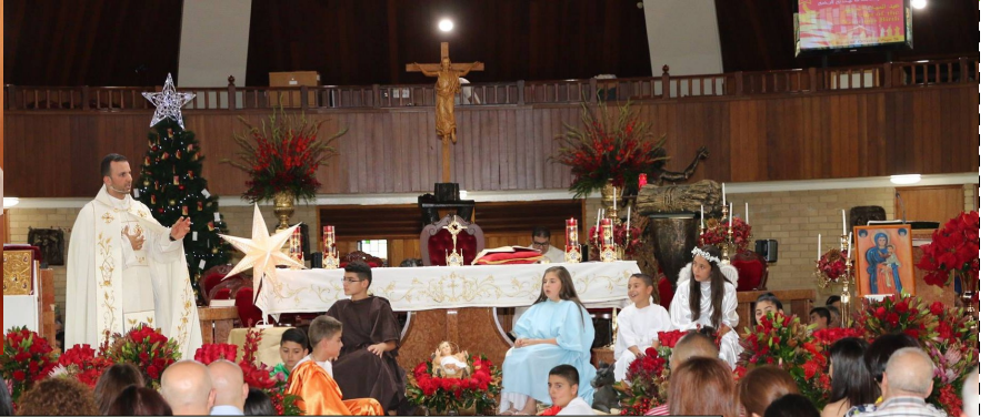
Christmas Eve Children's Mass & Nativity Re-enactment