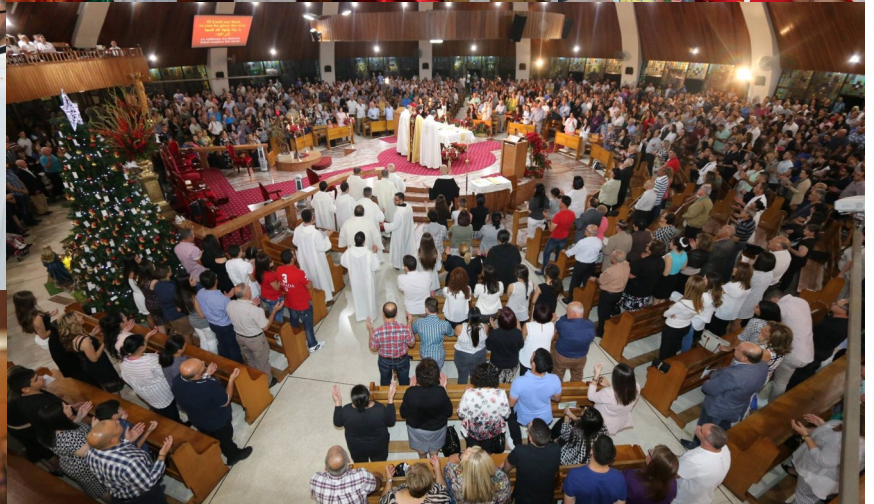
Christmas Eve Solemn Mass