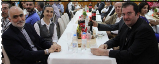
FDW Christmas Dinner