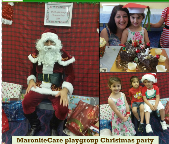
MaroniteCare playgroup Christmas party