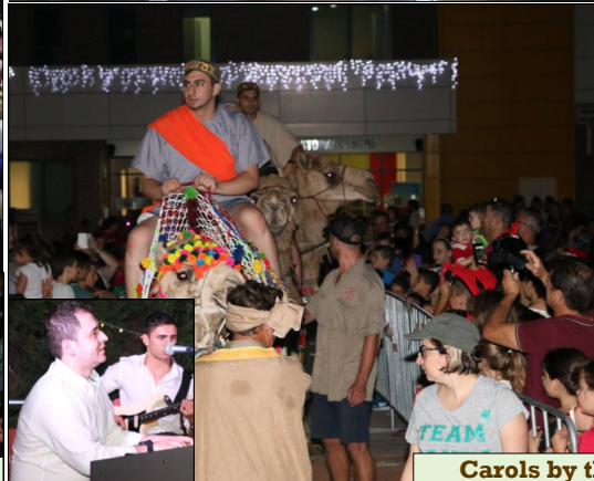
Carols by the Cathedral