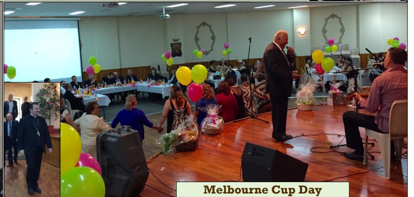
Melbourne Cup Day