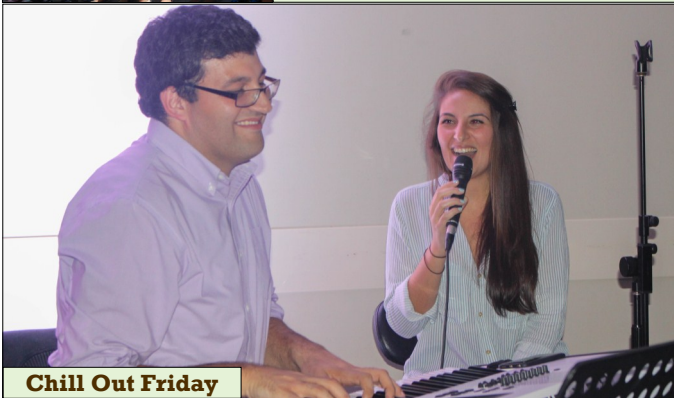
Chill Out Friday