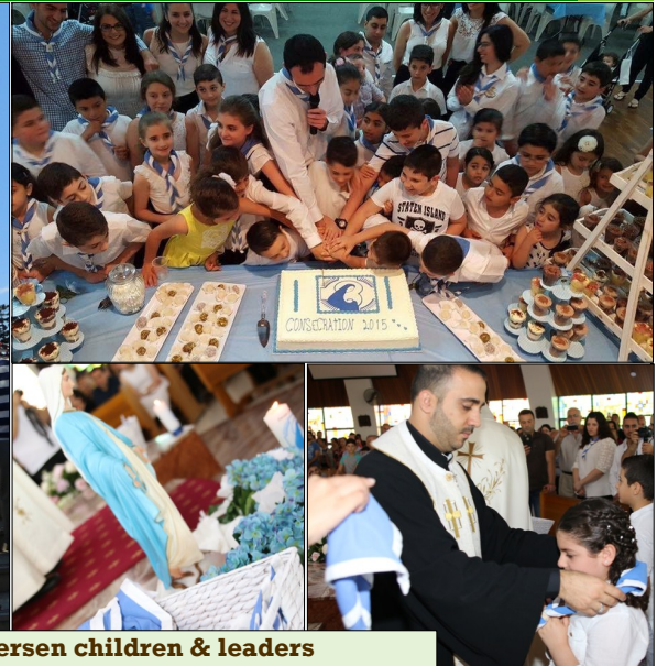
Congratulations to our newly consecrated Fersen children & leaders