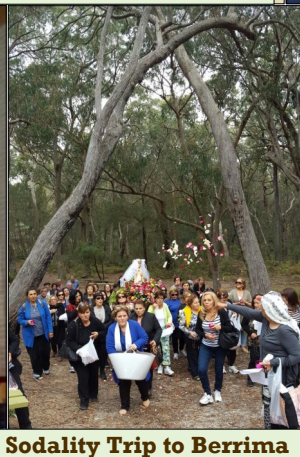
Sodality Trip to Berrima