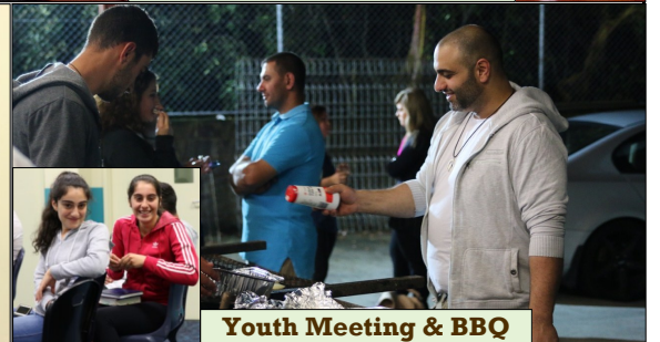
Youth Meeting & BBQ