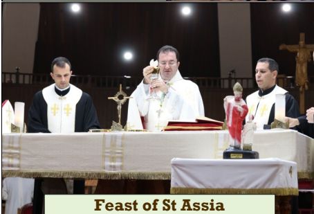
Feast of St Assia