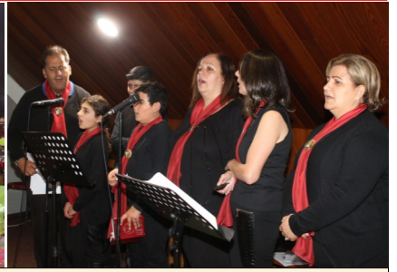
Saint Rita's Feast Mass - Friday 22nd May 2015