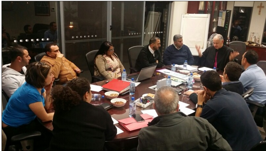
LOLO Pastoral Council Meeting held on Tuesday night.