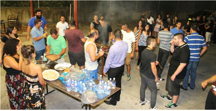
Our Youth enjoying their gathering over a BBQ after their monthly meeting.