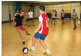
Young and old making great use of the facilities in the Community, Youth and Pastoral Centre.