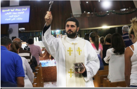
Feast of the Glorious Epiphany Mass and the Rite of Blessing of the Water celebrated at 10pm on the Eve of the Epiphany