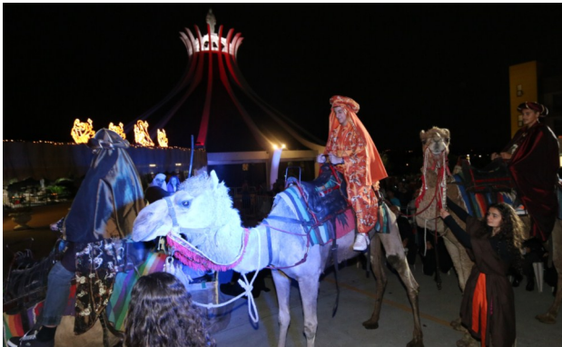
The Light of Christ illuminating our Parish, dispelling the darkness .... The Christmas Novena, The Seniors Committee with the Seniors Christmas luncheon and the annual Christmas Carols.