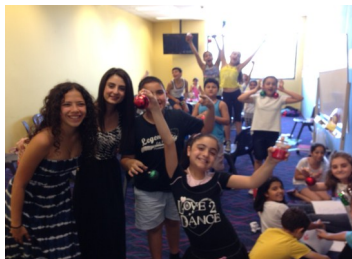
Fersen Children enjoying the activities and talks on Saturday.