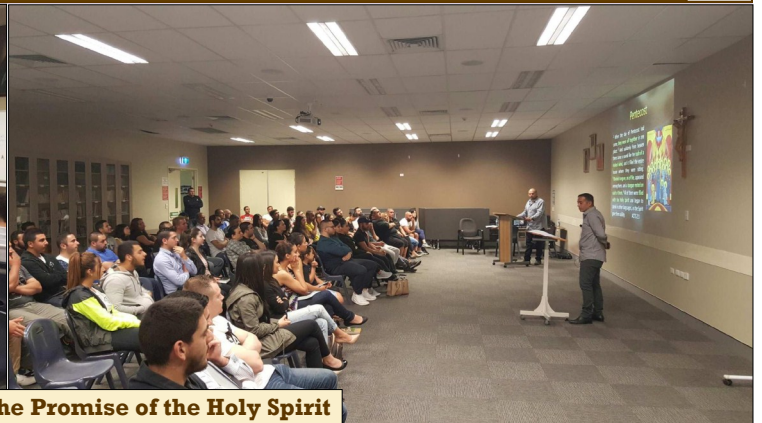
Thursday Bible Studies - The Promise of the Holy Spirit