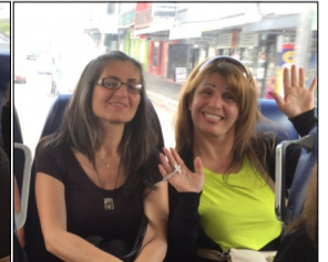
International Seniors Day held on the 1st October 2015 at St Maroun's Cathedral - Redfern