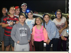
Annual Parish BBQ and Festival Night