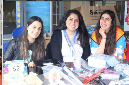
Family Fun & Rides Day