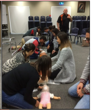
First Aid Classes