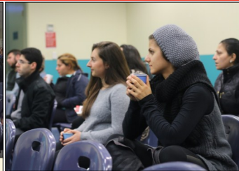
ACRATH Human Trafficking