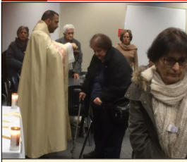
Seniors Mass & Activities