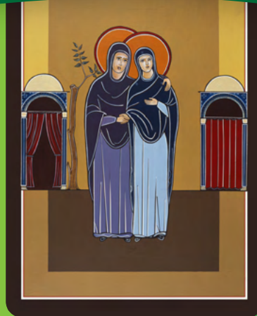
Visitation to Elizabeth Lk 1: 39-45 | Eph 1: 1-14

In bringing the unborn Christ to Zechariah's house, Mary witnesses the fruits of Christ's presence. The baby in Elizabeth's womb professes his faith in a manner appropriate to an unborn child, while his mother professes her faith in Christ's presence within his mother. As Pope Francis writes: "The joy of the gospel fills the hearts and lives of all who encounter Jesus." ( Evangelii Gaudium 1)