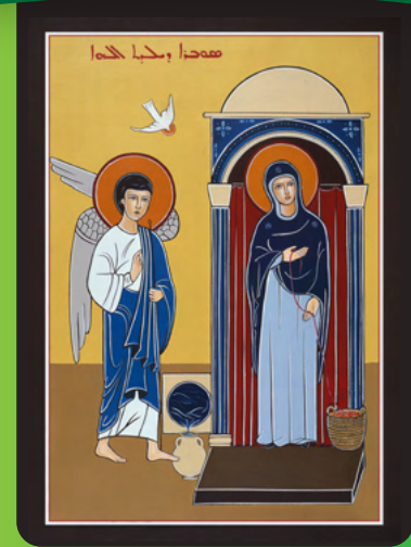
Announcement to Mary Lk 1: 26-38 | Gal 3: 15-22

We are all called to welcome and give birth to the Word in our existence to announce it to the world. Let us offer ourselves fully to God as Mary did, and may she, our