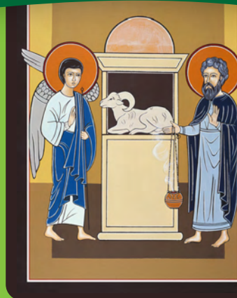
Announcement to Zechariah Lk 1: 1-25 | Rom 4: 13-25

Yet, at this miraculous announcement, the faith of Zechariah, an irreproachable priest of the Temple, having knowledge of the Scriptures and of the rites, is marked by serious doubt. Zechariah was left unable to speak until the birth; for he had doubted the word of God.