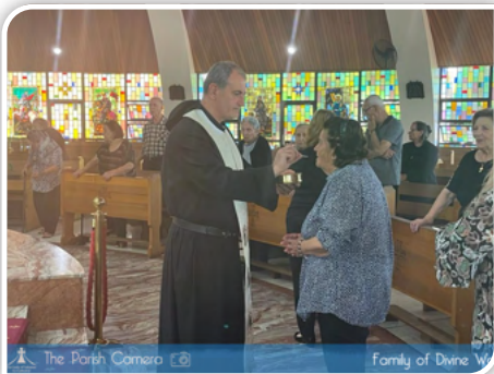
The Parish Camera Family of Divine Word