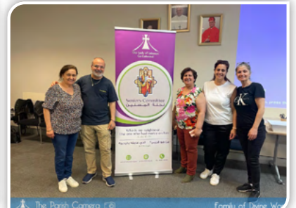
The Parish Camera Family of Divine Word