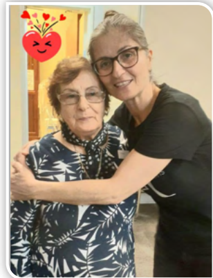
The Parish Camera Family of Divine Word