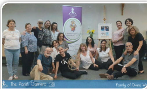
The Parish Camera Family of Divine Word