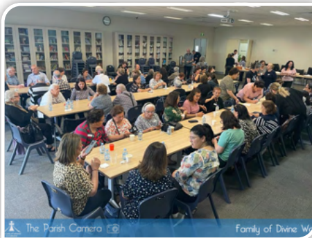
The Parish Camera Family of Divine Word