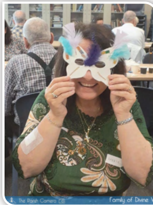
The Parish Camera Family of Divine Word