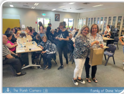
The Parish Camera Family of Divine Word