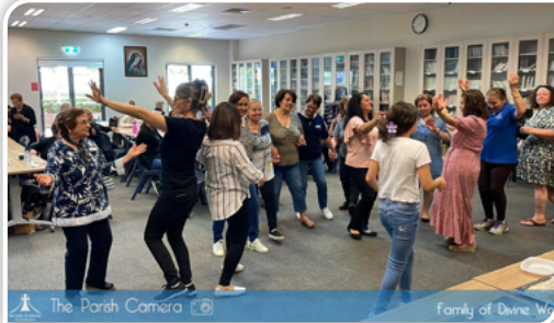
The Parish Camera Family of Divine Word