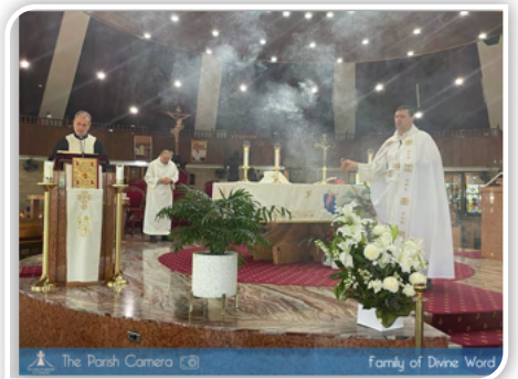
The Parish Camera Family of Divine Word