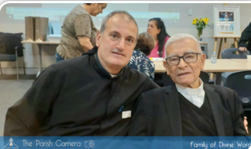
The Parish Camera Family of Divine Word