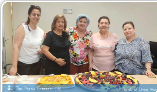
The Parish Camera Family of Divine Word