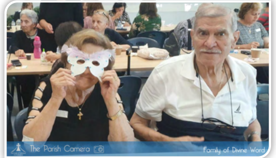
The Parish Camera Family of Divine Word