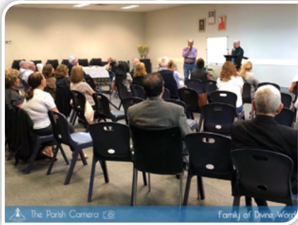
The Parish Camera Family of Divine Word