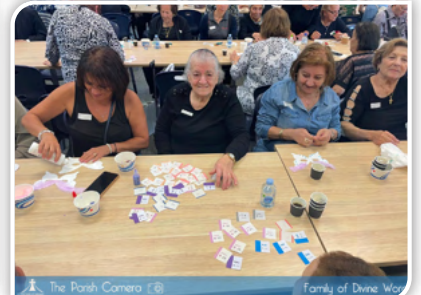
The Parish Camera Family of Divine Word