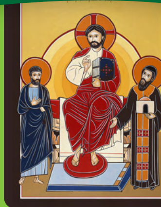
Consecration & Renewal of the Church Mt 16: 13-20 | Heb 9: 1-12