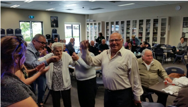
On Thursday, the Seniors Committee organised a special day for the elders of our parish. Everyone enjoyed the activities, lunch and entertainment and they also got up to a bit of dancing.