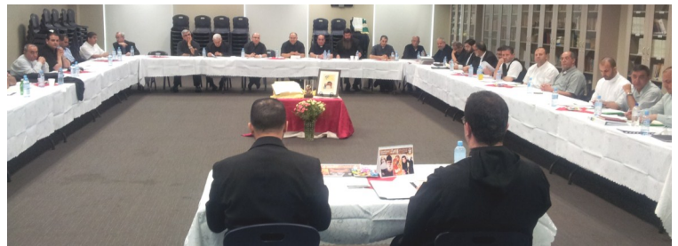
Diocesan Clergy Meeting on Tuesday & Wednesday