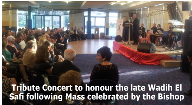
Tribute Concert to honour the late Wadih El Safi following Mass celebrated by the Bishop