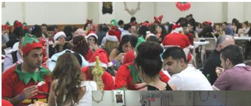
Over 200 Youth at their Dress-up Christmas Dinner on Friday